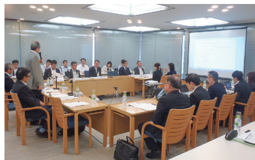
第1回検討会の様子

今年度は5回程度の検討会を開催し、今後、全国の消防本部においてシステムを円滑に導入できるよう、技術的条件仕様を含め最終報告として取りまとめる予定です。